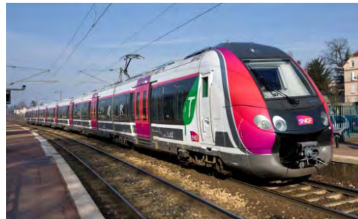
172 (+ opties) NAT (Nouvelle Automotrice Transilien) treinen, SNCF, Frankrijk