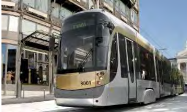
220 BOMBARDIER FLEXITY Outlook trams voor MIVB, Brussel, België