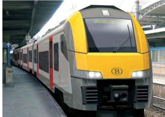
200 Desiro ML multiple units (in onderaanneming voor Siemens), voor het Brussels GEN, België (NMBS)