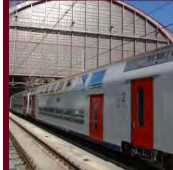
492 dubbeldeksrijtuigen type M6 voor de NMBS, België