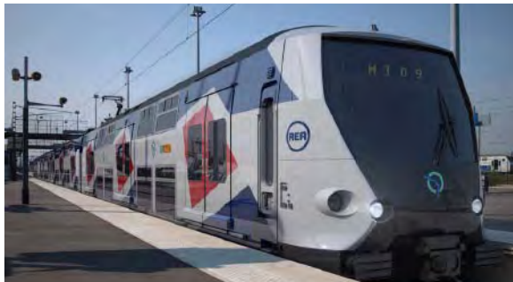
180 (+ 210 optie) MI09 rijkundigen, voor RATP, Frankrijk