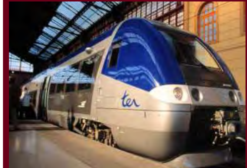
700 AGC (Autorail Grande Capacité) Regionale Exprestreinen voor de Franse Regio's